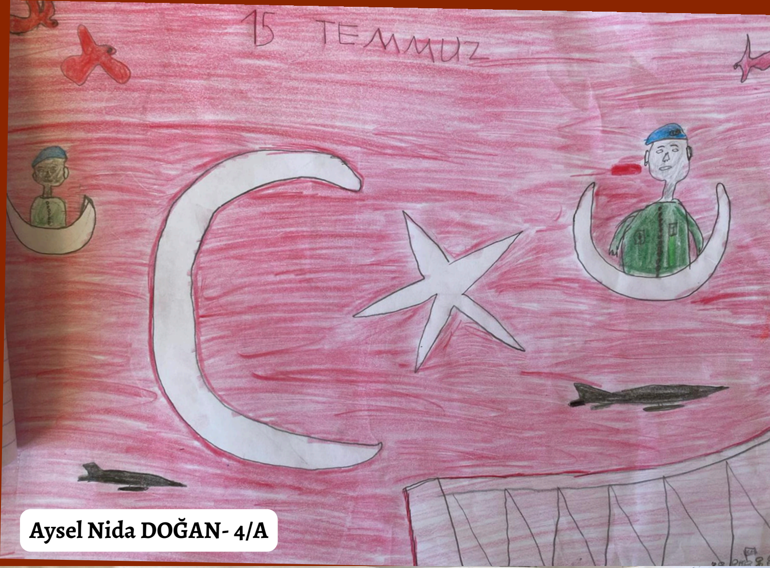
Aysel Nida DOĞAN- 4/A