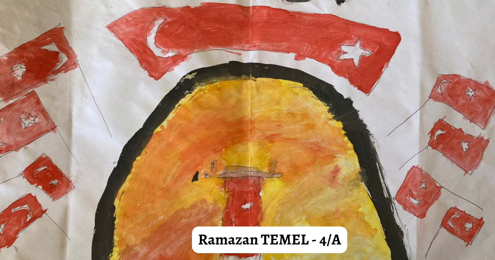
Ramazan TEMEL - 4/A